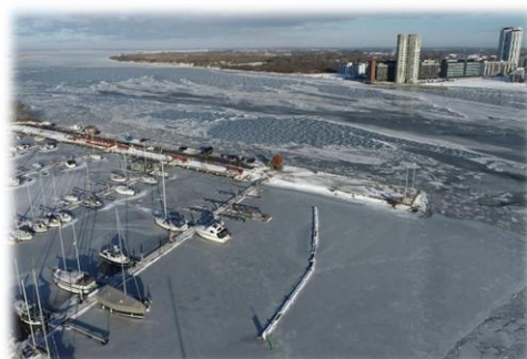
Tak for flotte dronefotos: Mikkel, bro 7 og Bent, bro 4